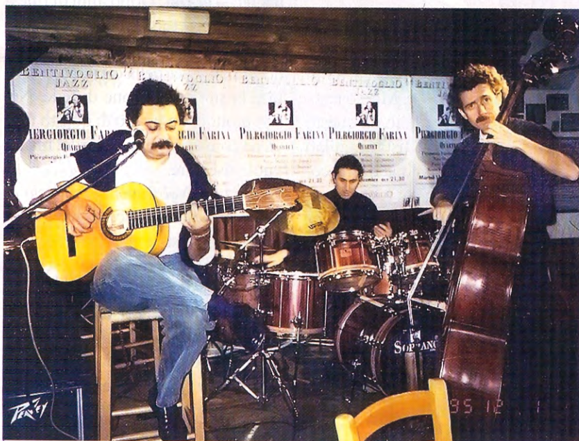
EREDE DEL MAESTRO BADEN POWELL - Con lui partecipa a un festival. La prima chitarra gliela regala il padre